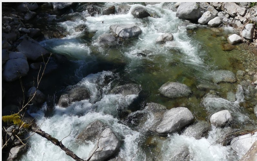
La vallée de Luech (N Thomas)