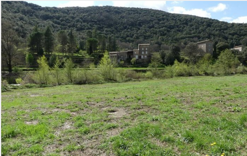
Le Travers (N Thomas)