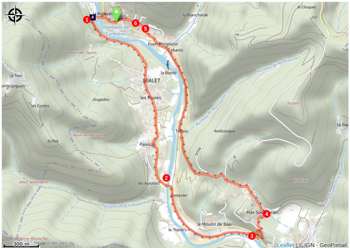
Le pont des Camisards (A)