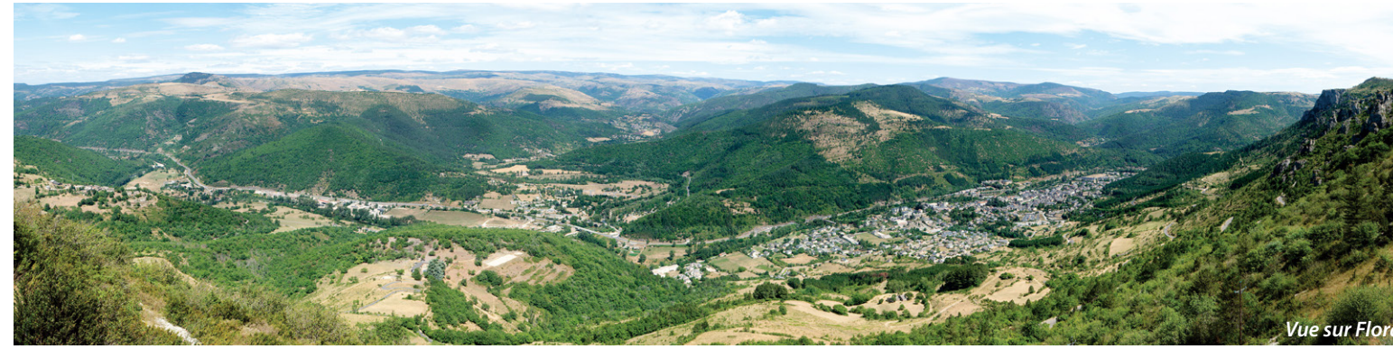
Vue sur Florac

Des rives du Tarnon à la source du Pêcher en passant par le Château, nous vous invitons à découvrir la ville et son histoire tourmentée de bastion protestant.